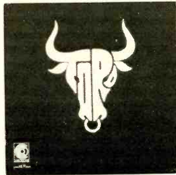
"TORO" CLP 106

LATIN ROCK, LATIN HUSTLE TORO (AIN'T BULL...)