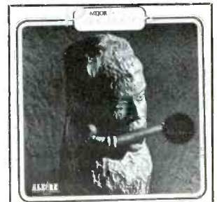
Alegre CLPA 7011

New York Dist.: All Art Distributors, 639 10th Ave., N.Y.C. (212) 541-8347 Malverne Distributors, Inc., 35-35 35th St., L.I.C., N.Y.C. (212) 392-5700 Puerto Rico Dist.: Allied Wholesale, Calle Cerra 610 Santurce, P.R. 00927 (809) 725-9255 Miami Dist.: Sonido y Discos Inc., 1160 S.W. 1st St., Miami, Fla. 33130 (305) 373-1740