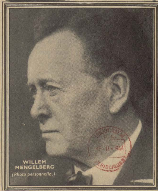
WILLEM MENGELBERG