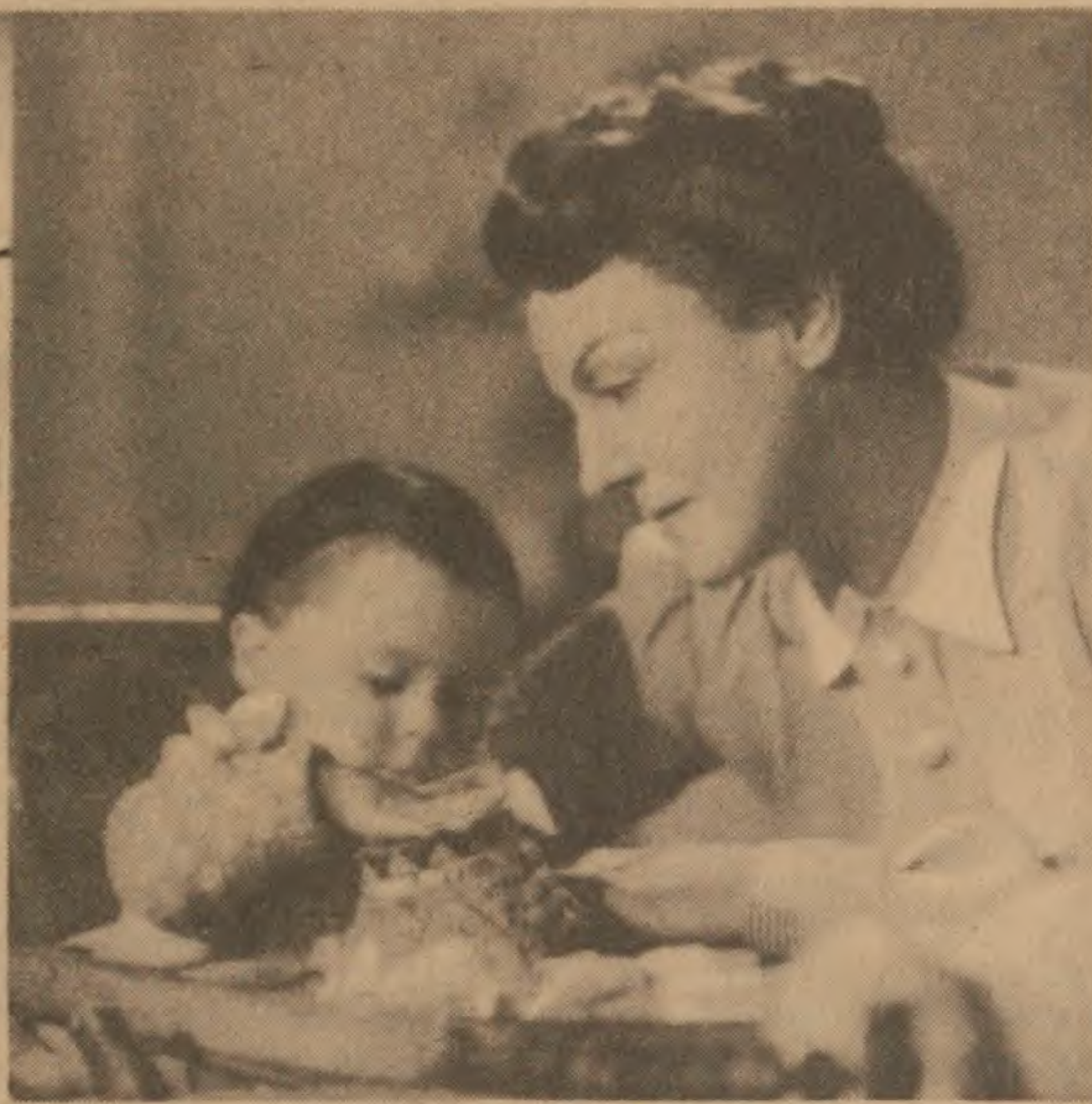
Gaby Morlay vient de trouver dans le « Voile bleu » l'un de ses meilleurs rôles.

Ce scénario de comédie philosophique dû à Pierre Guerlais et fort bien dialogué par Pierre Bost a une qualité trop rare pour ne pas être signalée : l'originalité. Il a permis à Jean de Limur de composer un film extrêmement curieux et qui plaira précisément dans la mesure où il s'écarte du déjà vu . L'intrigue commence comme un drame noir mais passe bientôt dans le domaine de la fantaisie. Il a, pour s'y maintenir, outre une habile facture, tout le talent de ses interprètes et tout d'abord d'Aimé Clariond, qui a fait de M. Désert un type remarquablement campé. Jacqueline Laurent, que l'on n'avait pas revue depuis le Jour se lève , semble avoir un peu perdu de ses qualités d'ingénue, mais Georges Marchal fait des débuts excellents dans le rôle du botaniste amoureux de ses fleurs.