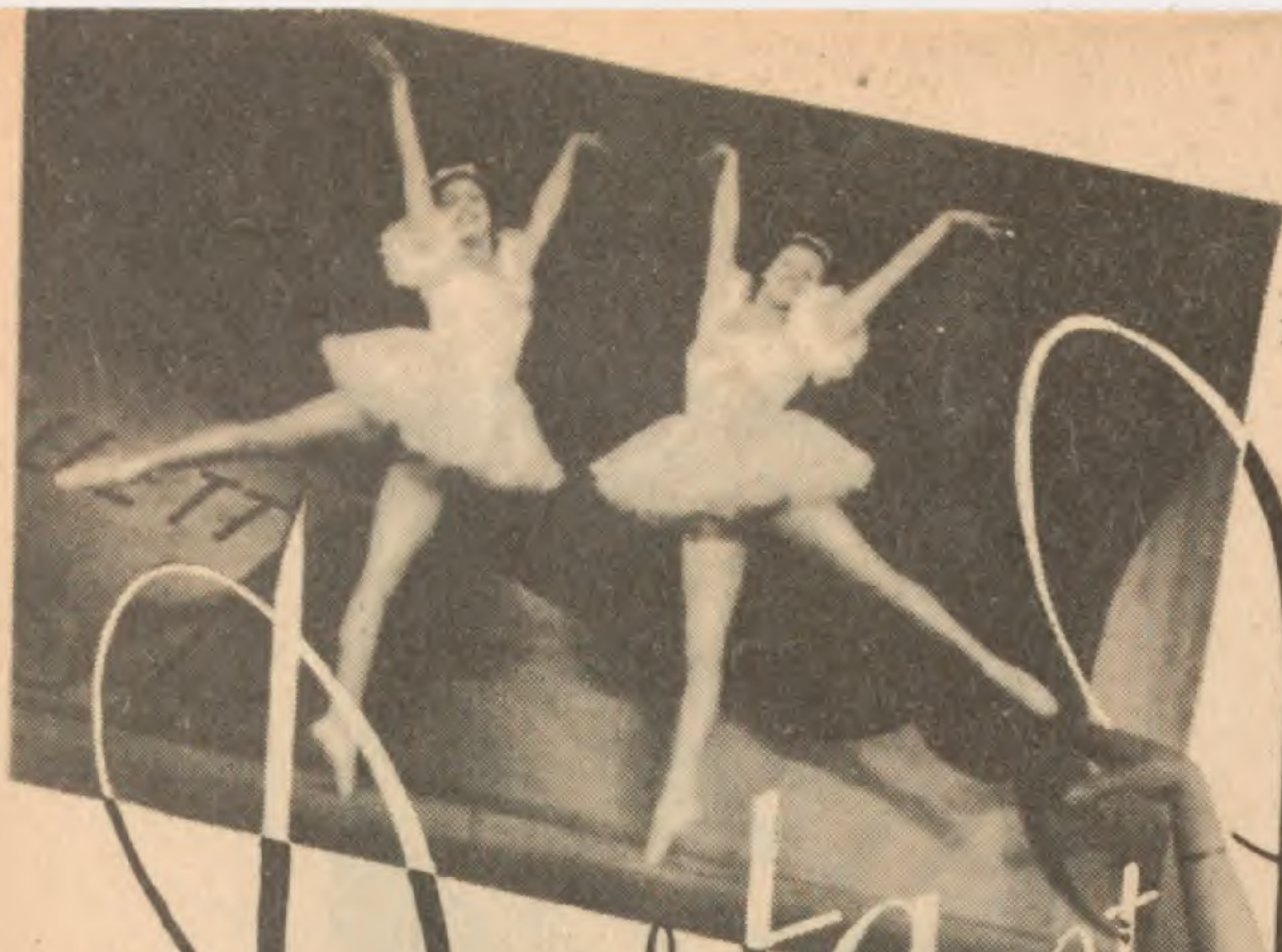
LA DANSE CLASSIQUE