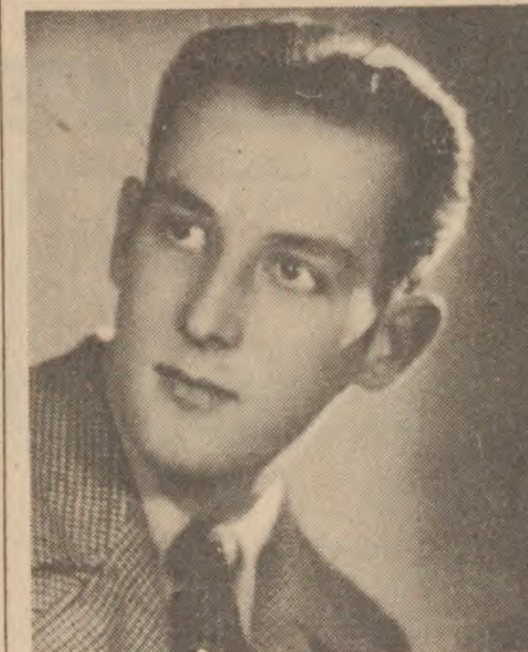
JEAN NEVEU (Photo personnelle)