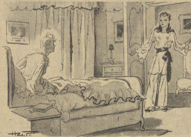
14 ...vêtue d'un pyjama de soie blanche, je l'ai toute vue d'un seul regard.