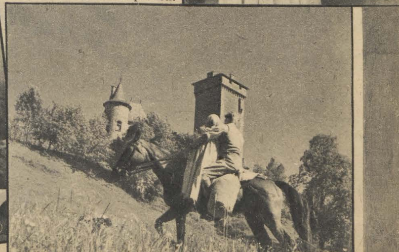
1. Jean Marais et Madeleine Sologne incarnent les amants éternels...