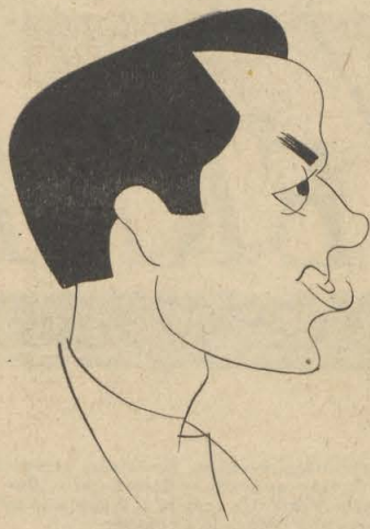
JEAN MERCURY (Croquis Jan Mara.)

locker (C. Millocker), par l'Orch. de l'Opéra national de Berlin, dir. Hansgeorg Otto.