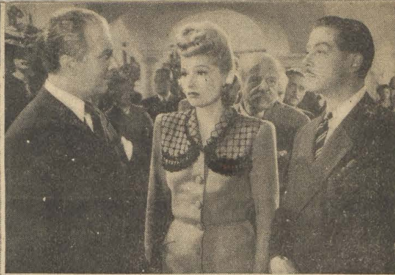
Deux scènes de « DOMINO » (Photos extraites du film.)