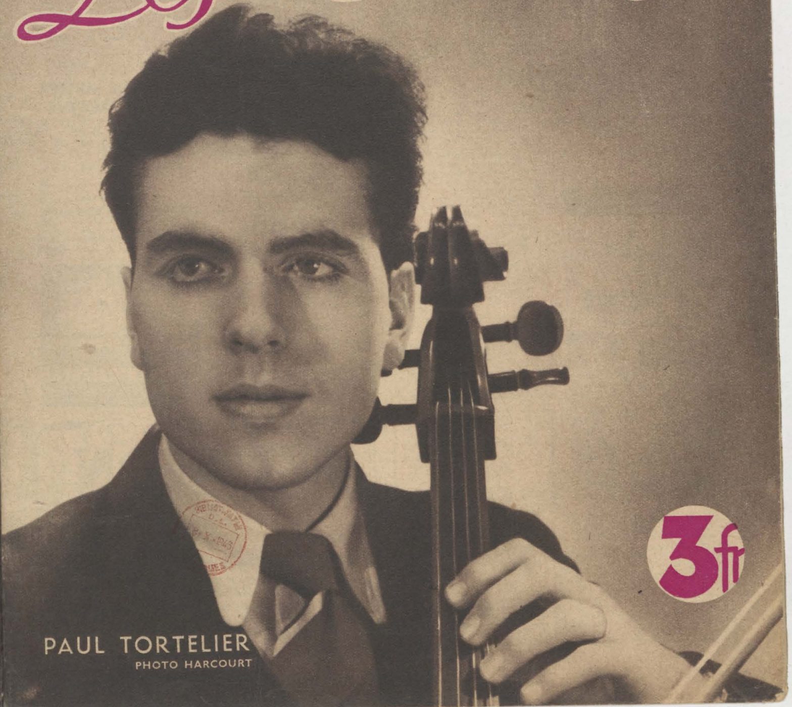
PAUL TORTELIER