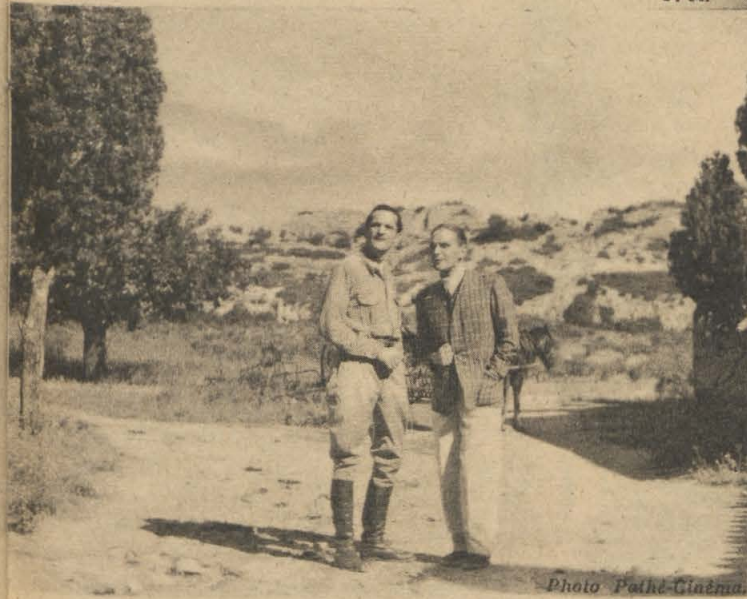
Jacques Dumesnil, Pierre Blanchar dans « Secrets ».