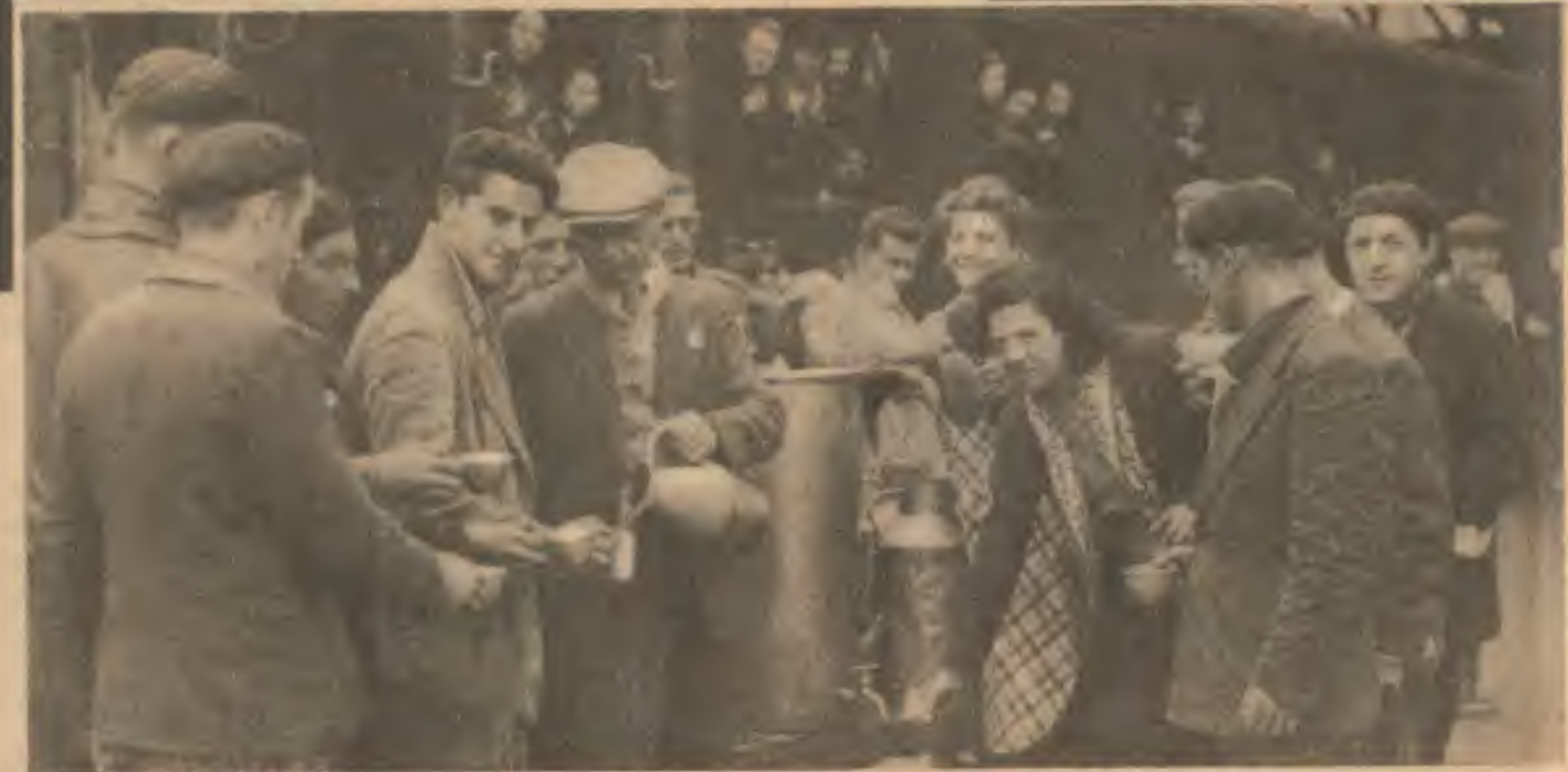
Chaque jour, de nombreux ouvriers et ouvrières quittent Paris pour participer à la relève. Une distribution de café avant le départ d'un train.