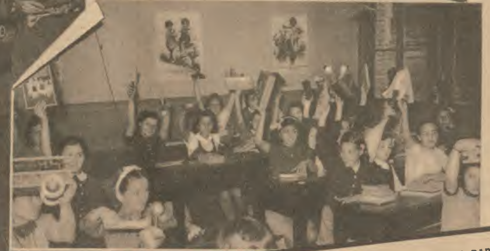
Dans tout Paris, les enfants des écoles ont recueilli des jouets pour leurs petits camarades déshérités. Dans une classe, chacun montre sa « récolte ». Et les jouets recueillis sont remis en état dans des ateliers du Secours National.