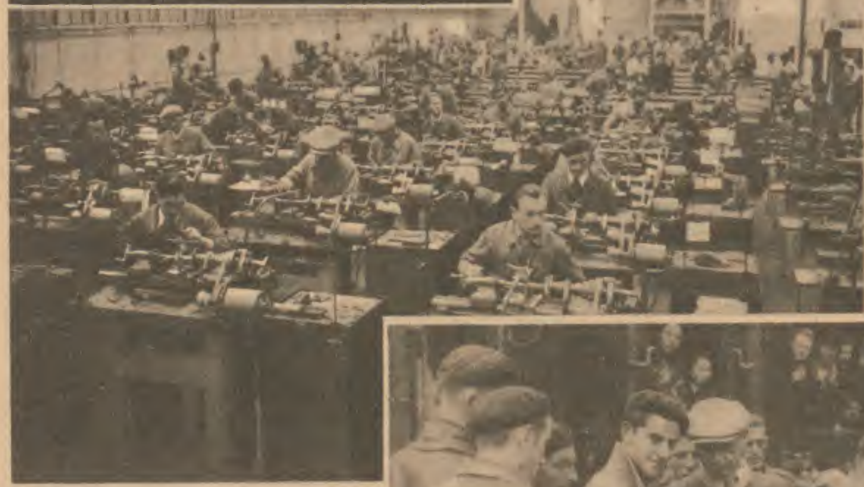
Un des ateliers parisiens où des ouvriers volontaires pour la relève font un stage de rééducation.