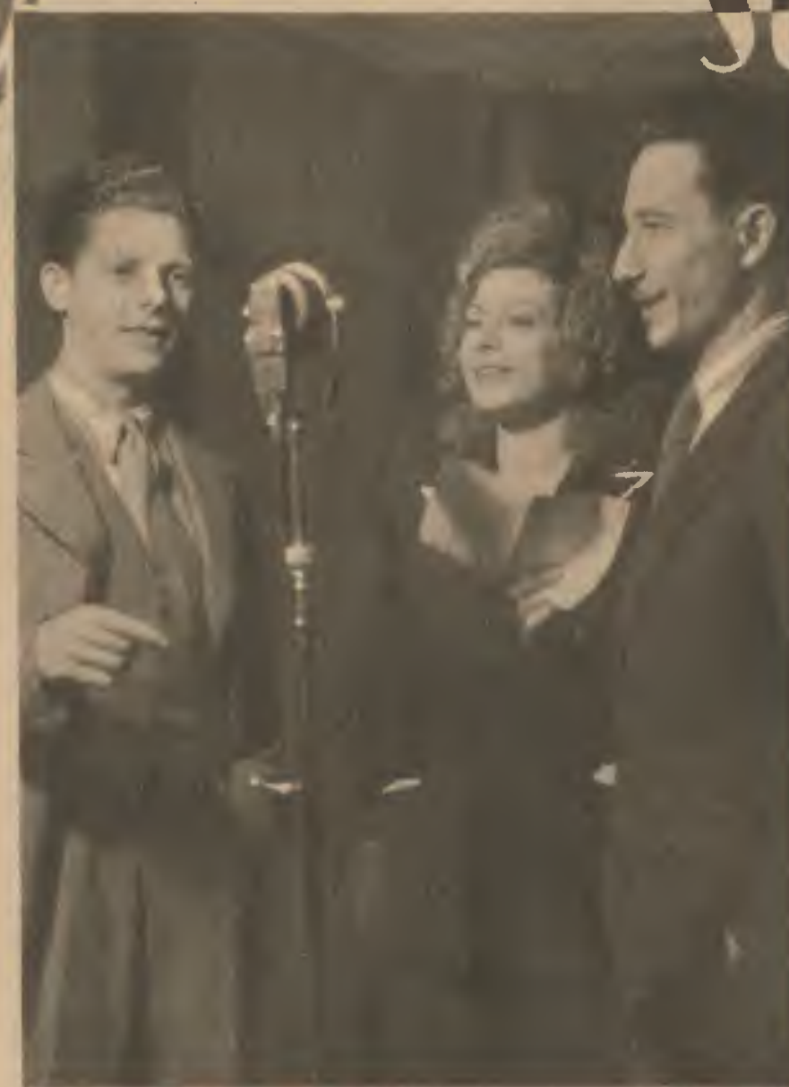
Non... car il ne s'agissait que de fausses barbes. Les voici près du micro tels qu'ils sont dans la vie.