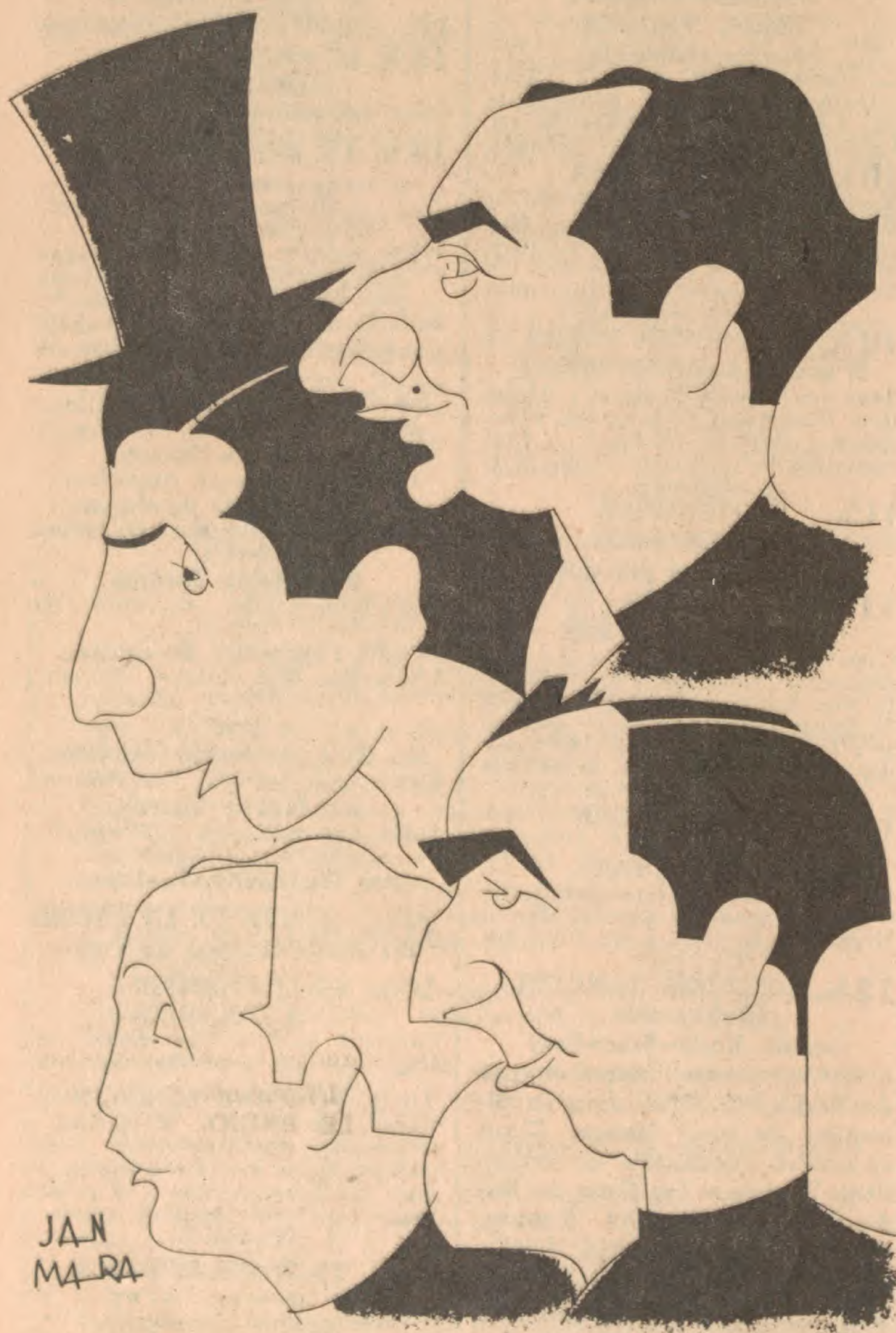
LE TRIO DES QUATRE