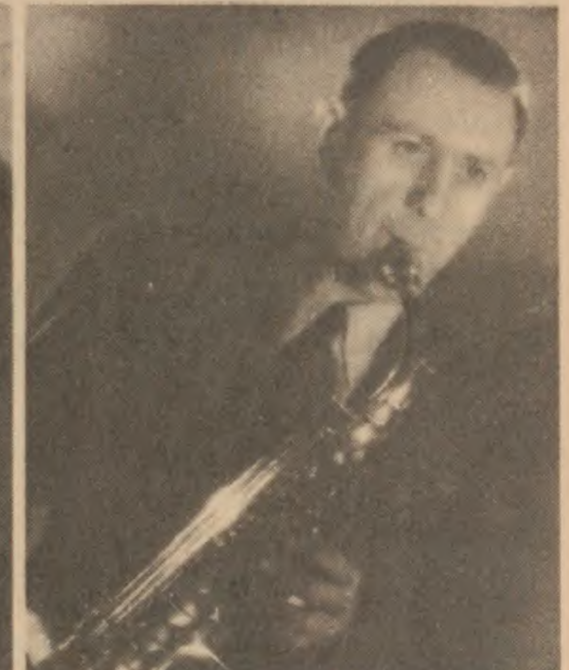
MARCEL MULE