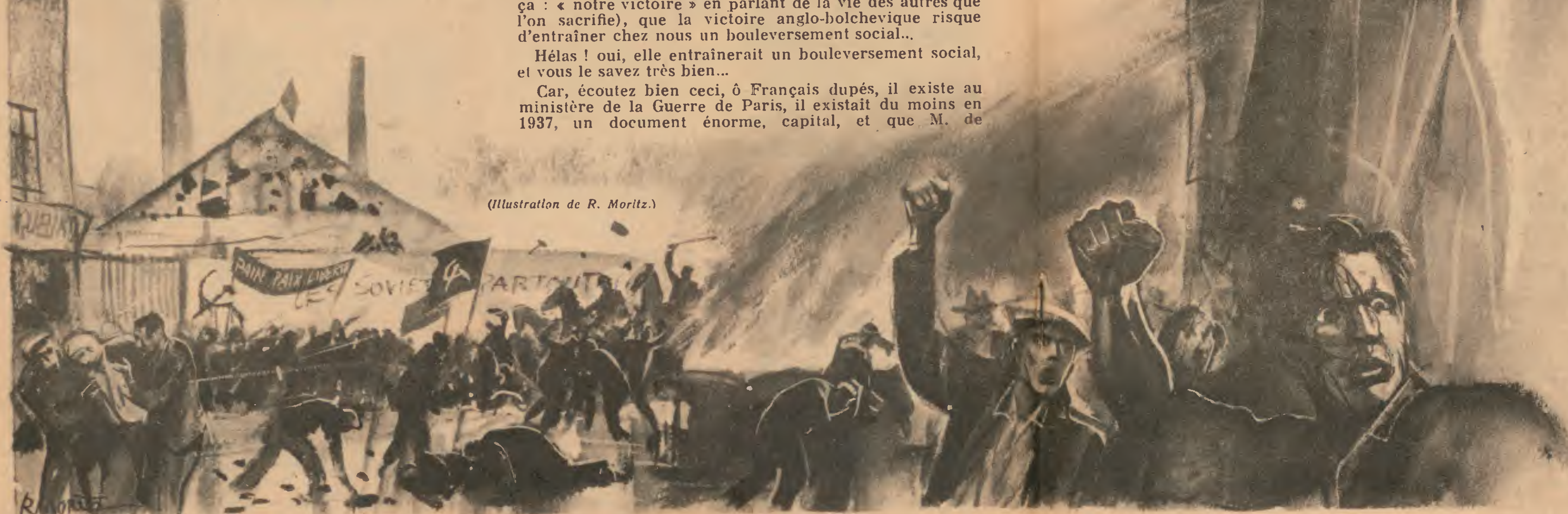
(Illustration de R. Moritz.)

« La France n'a plus de mains à vous tendre, mais seulement le poing de la haine que vous nous avez appris à lever vers l'ennemi, qui est aujourd'hui pour nous, la terre des Soviets, de l'anarchie et de la fourberie. »