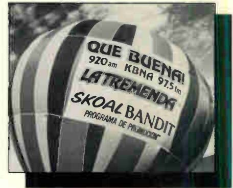
Que Buena KBNA atop a hot air balloon at the El Paso Street Festival.