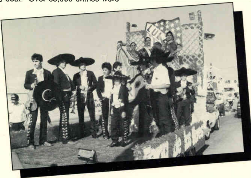
One of the floats participating in KUNO's 16 de Septiembre Parade.