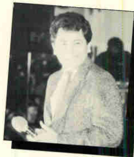
Salvadorean star Alvaro Torres, one of the top performers at the Festival, entertaining the crowd.