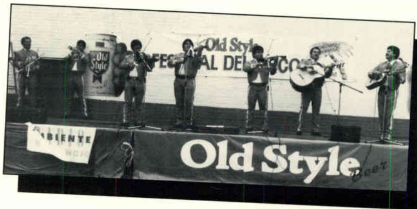
One of the popular groups at the Pan American Festival entertains the crowd.

WOJO on-air personalities broadcast live from the Arch Mini-Festival and gave away WOJO T-shirts. The festivities included live musical entertainers, and local merchants displayed unique Mexican arts and crafts. WOJO was the official Spanish-language radio station for Chicago's Pan American Festival held August 4-6. The event began with "Gala Night," a