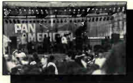
Stage preparations for the Pan American Festival.