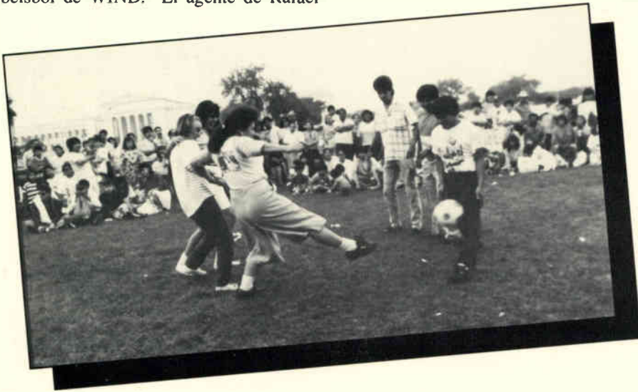
Family members enjoying a soccer game at WIND's "Family Picnic" at Grant Park.