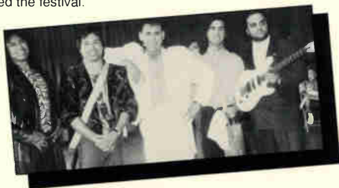
The musical group Los Diablos was a main attraction at KLAT's Mexican Independence Day Festival.