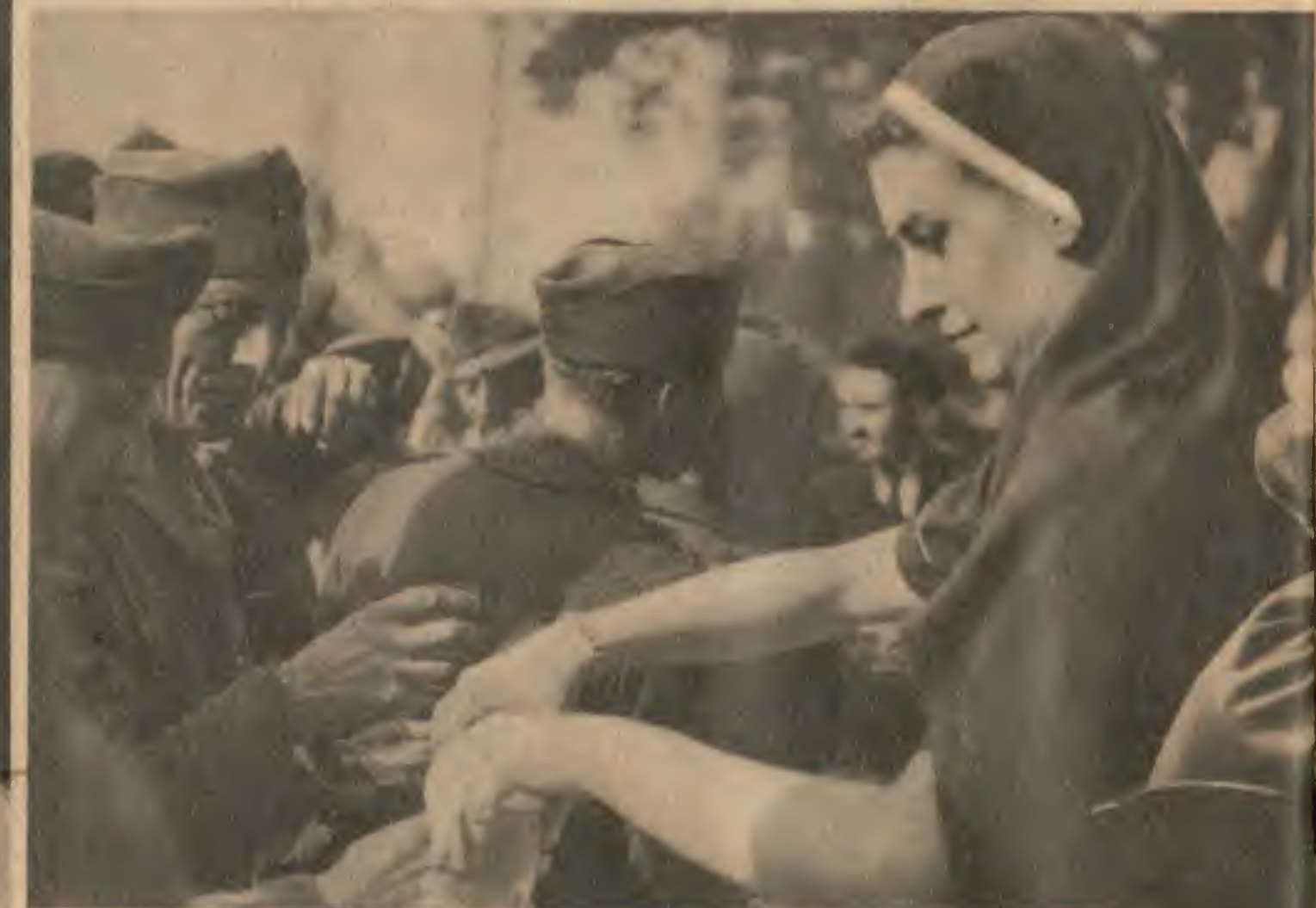
Dans la cour de la gare de Serqueux, la Croix-Rouge Française, avec un dévouement admirable, s'est occupée des prisonniers et les a ravitaillés magnifiquement. Après un long voyage, les hommes n'ont pas manqué de faire honneur à ce premier casse-croûte dans leur Normandie natale.