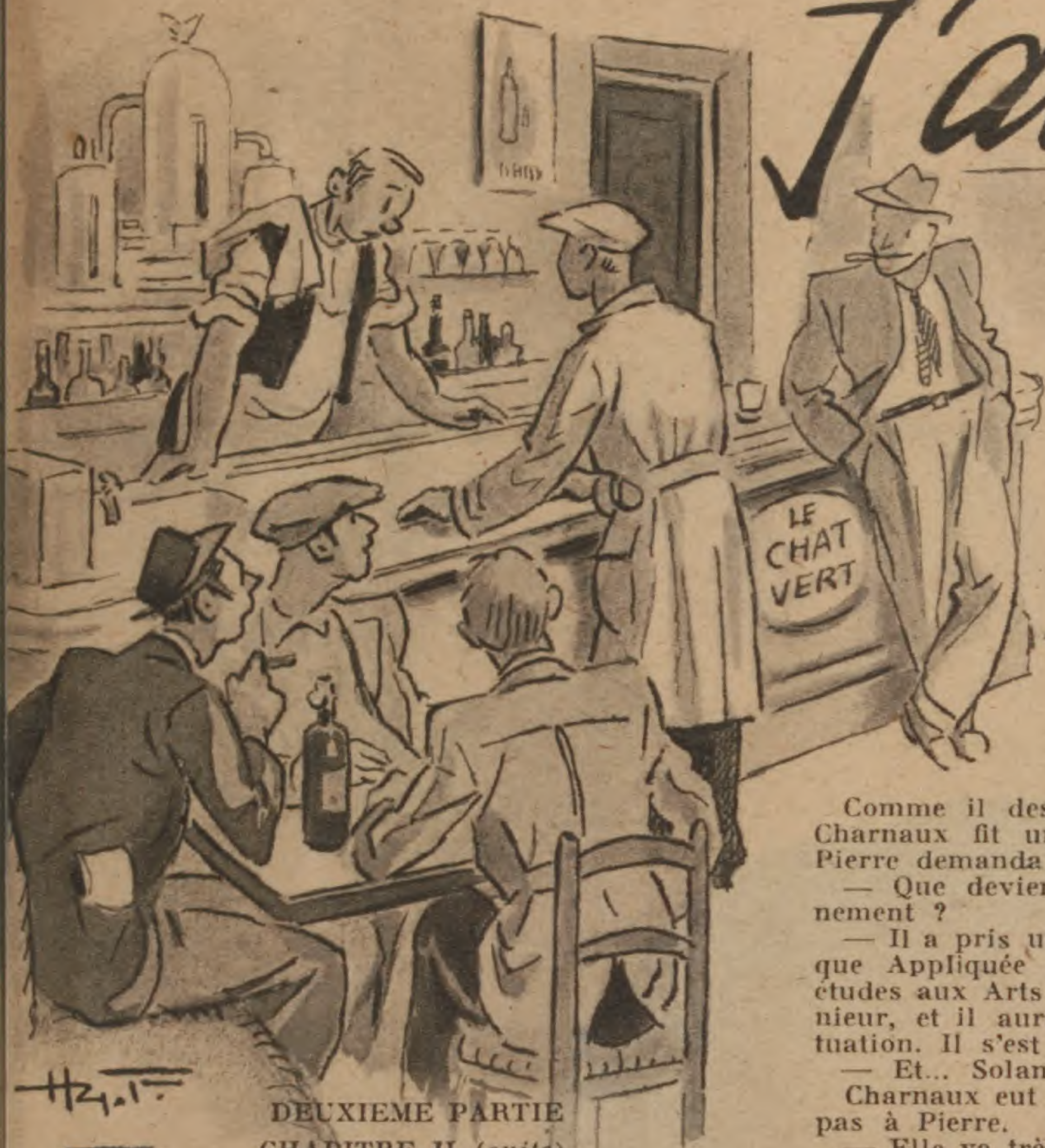
DEUXIEME PARTIE CHAPITRE II (suite)

... Dans la soirée, les deux hommes, le cœur serré par une même émotion, allèrent en pèlerinage dans l'appartement de la rue Cambronne, dont Charnaux continuait d'assumer le loyer, mais qu'il n'aurait habité pour rien au monde.