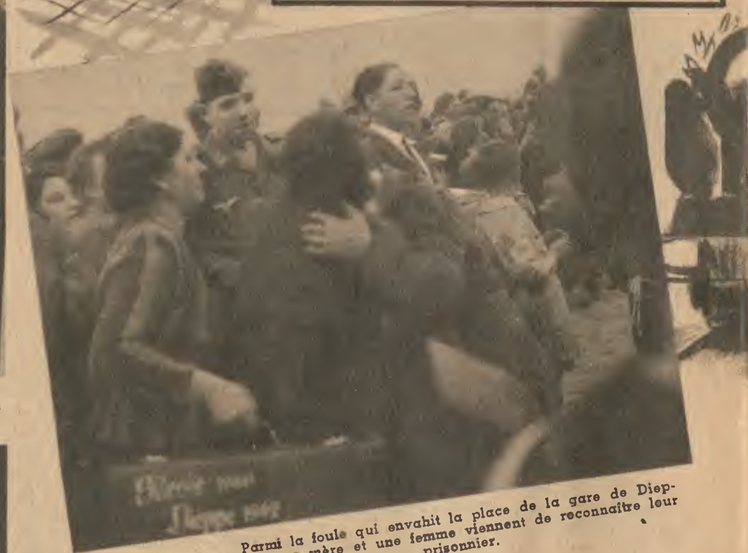
Parmi la foule qui envahit la place de la gare de Dieppe, une mère et une femme viennent de reconnaître leur prisonnier.

Ainsi qu'il le dit dans son « En Trois Mots », Roland Tessier s'est rendu à Serqueux et à Dieppe, pour l'arrivée des prisonniers libérés sur l'ordre du Führer. Accompagné du photographe Baerthélé, des Services de Presse de Radio-Paris, et travaillant en étroite liaison avec les Services de Radio-reportage du grand poste parisien, il a rapporté de son voyage le reportage photographique de cette double page.