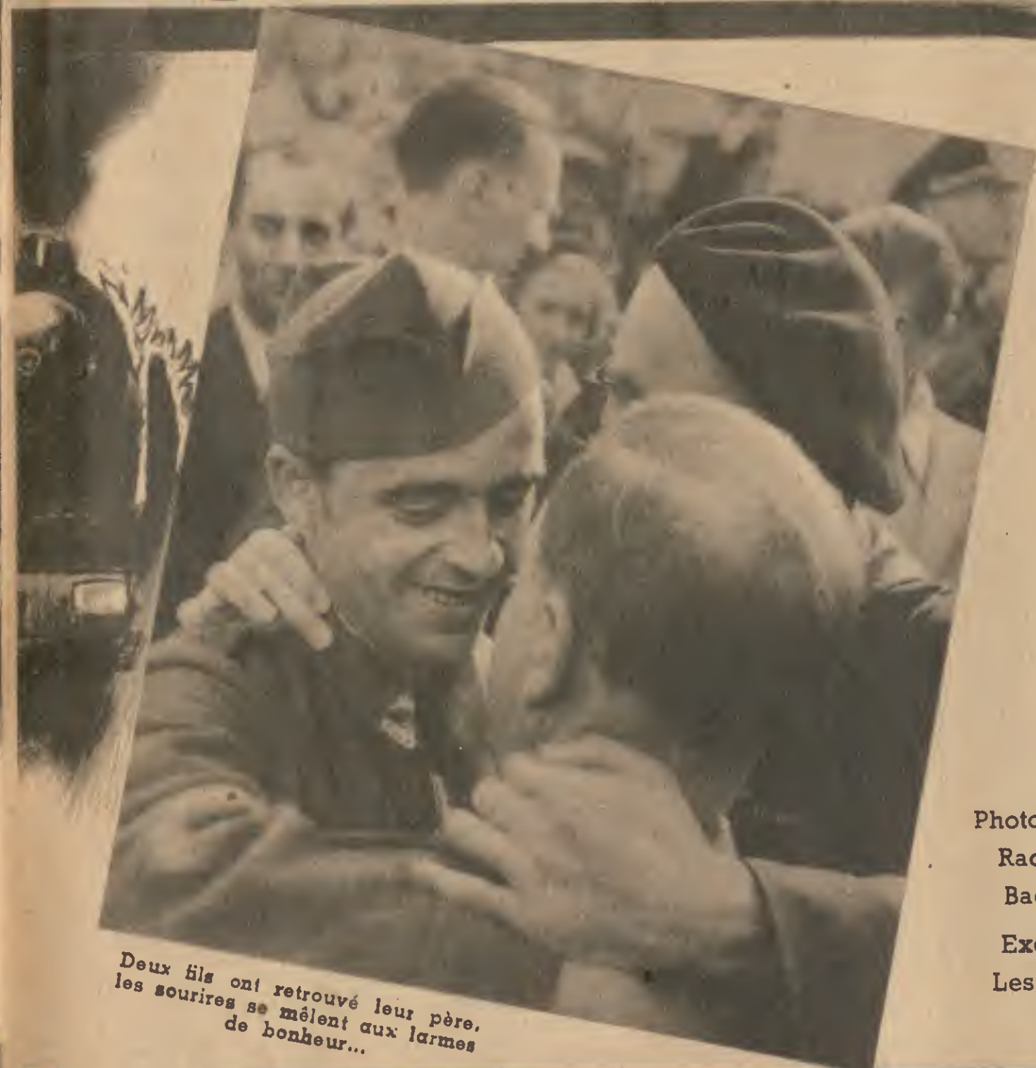
Deux fils ont retrouvé leur père, les sourires se mêlent aux larmes de bonheur...