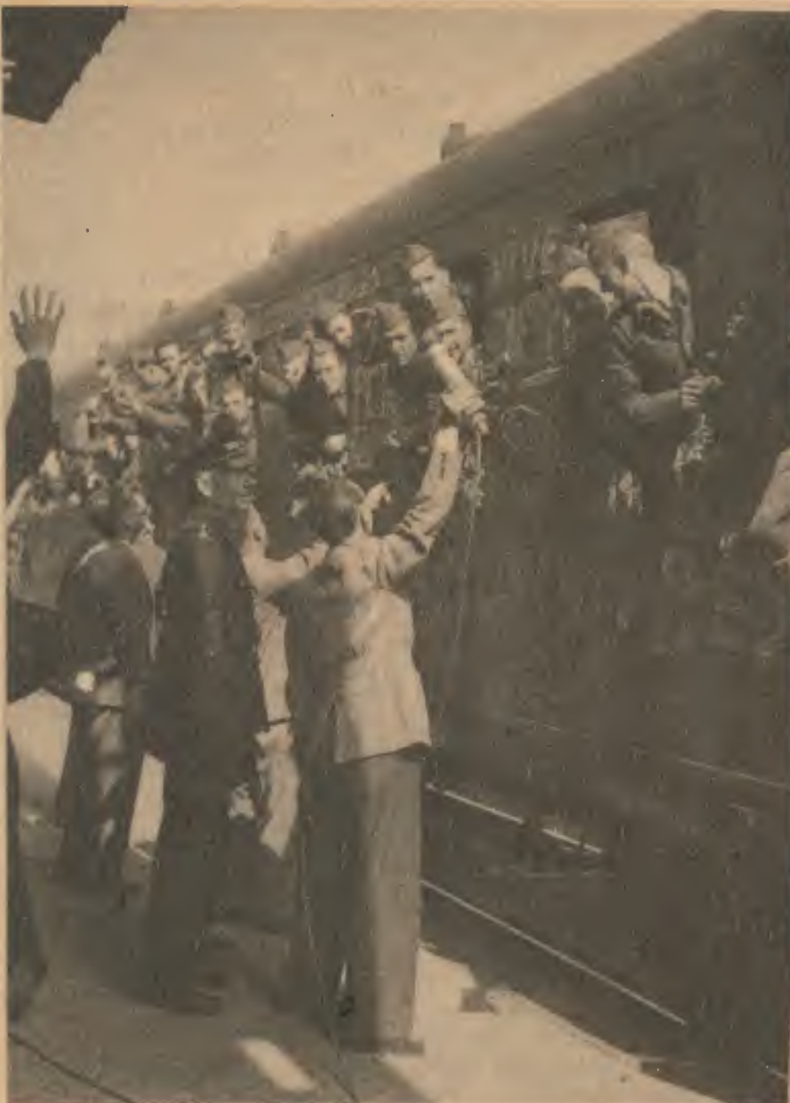
Voici l'arrivée en gare de Serqueux du train de prisonniers dieppois libérés sur l'ordre du Führer.