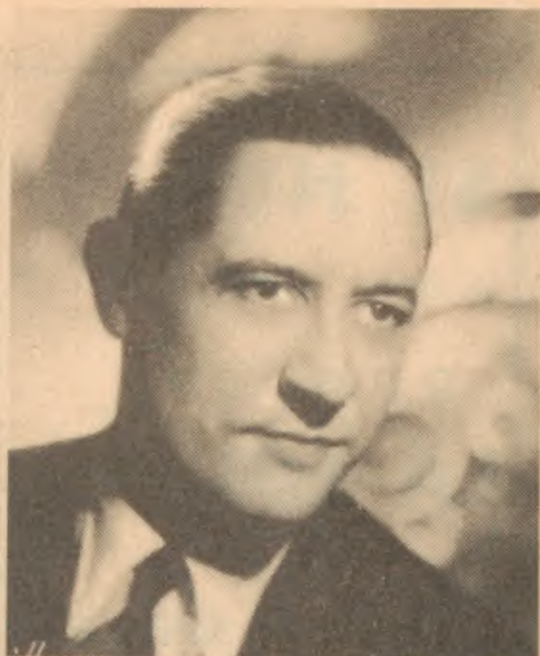
GEORGES THILL