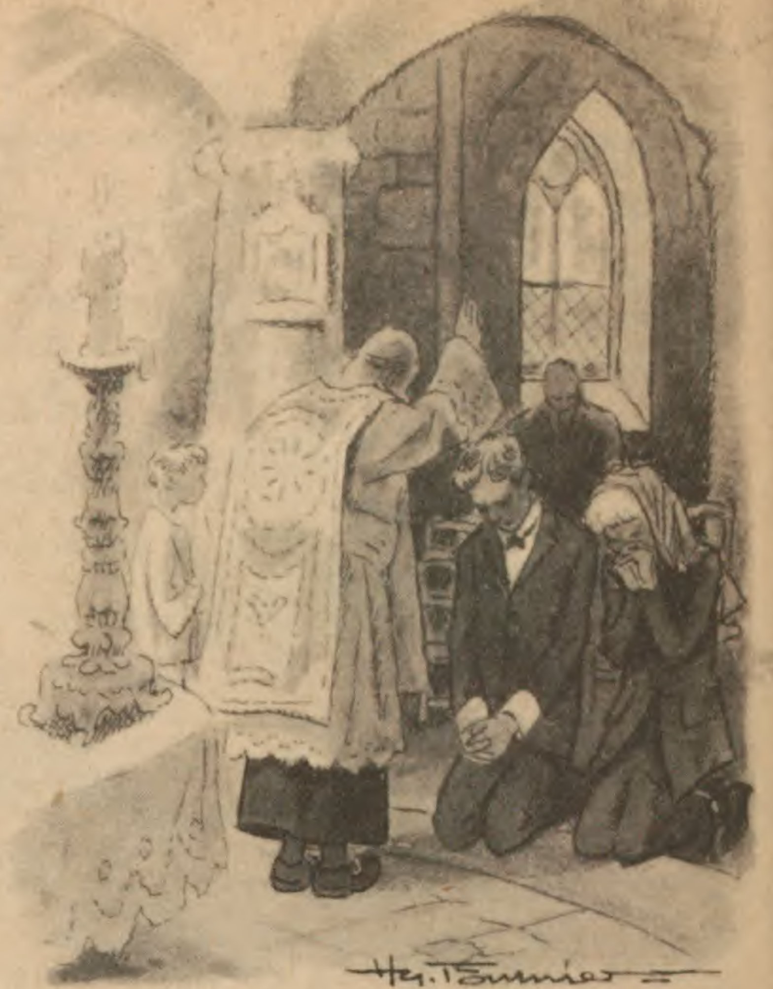
Ils partirent pour l'Espagne. Un prêtre les maria dans une chapelle abandonnée.

Que Jean l'aimât toujours, elle n'en doutait pas une seconde. Mais s'il ne le disait point, il était visible qu'il souffrait de l'exis-