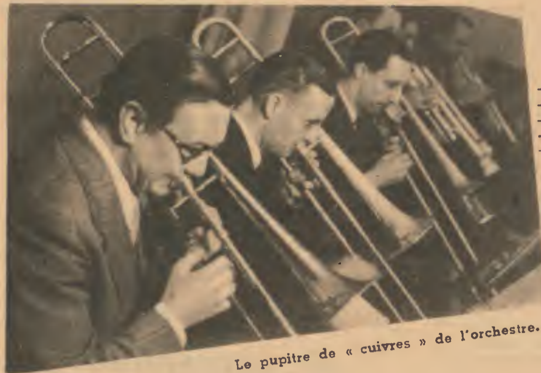
Le pupitre de « cuivres » de l'orchestre.