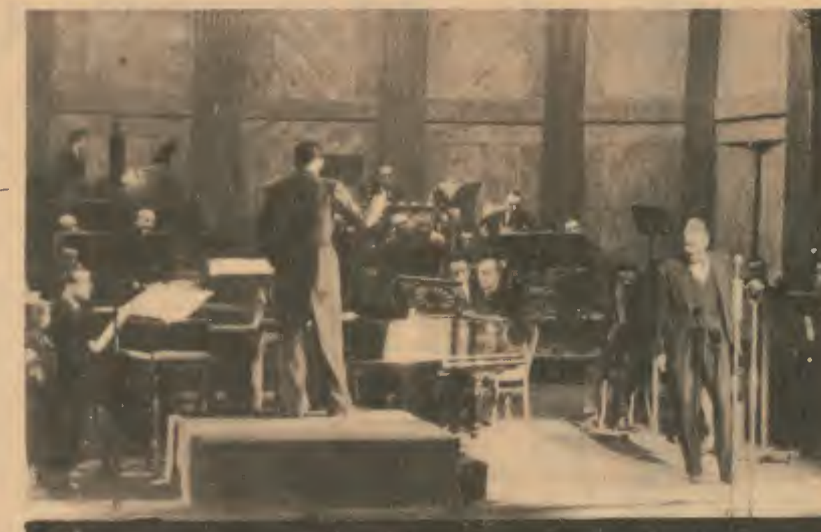
Maurice Chevalier au cours d'un grand concert public de « Radio-Paris », au Théâtre des Champs-Élysées.