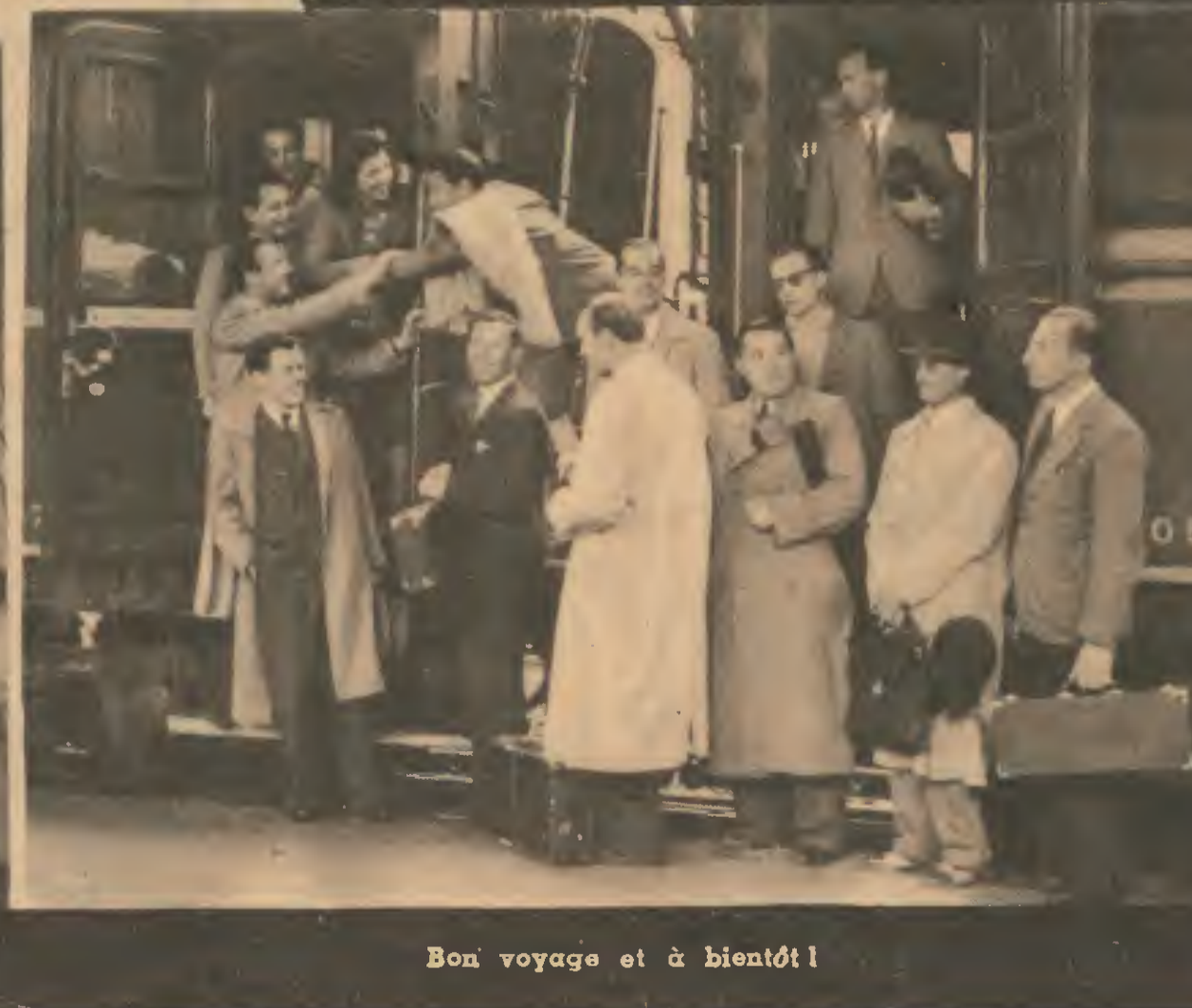
Bon voyage et à bientôt !