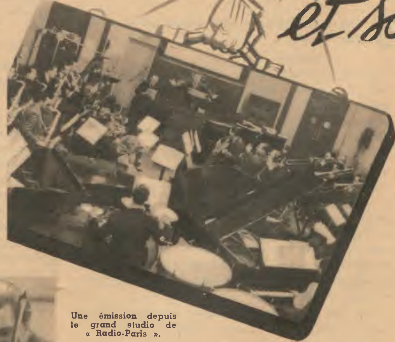
Une émission depuis le grand studio de « Radio-Paris ».

Certains des succès de Raymond Legrand rappellent cette époque : Esprit , qui est une chanson d'optimisme et de volonté de revivre, Parlez-moi du printemps , El Rancho