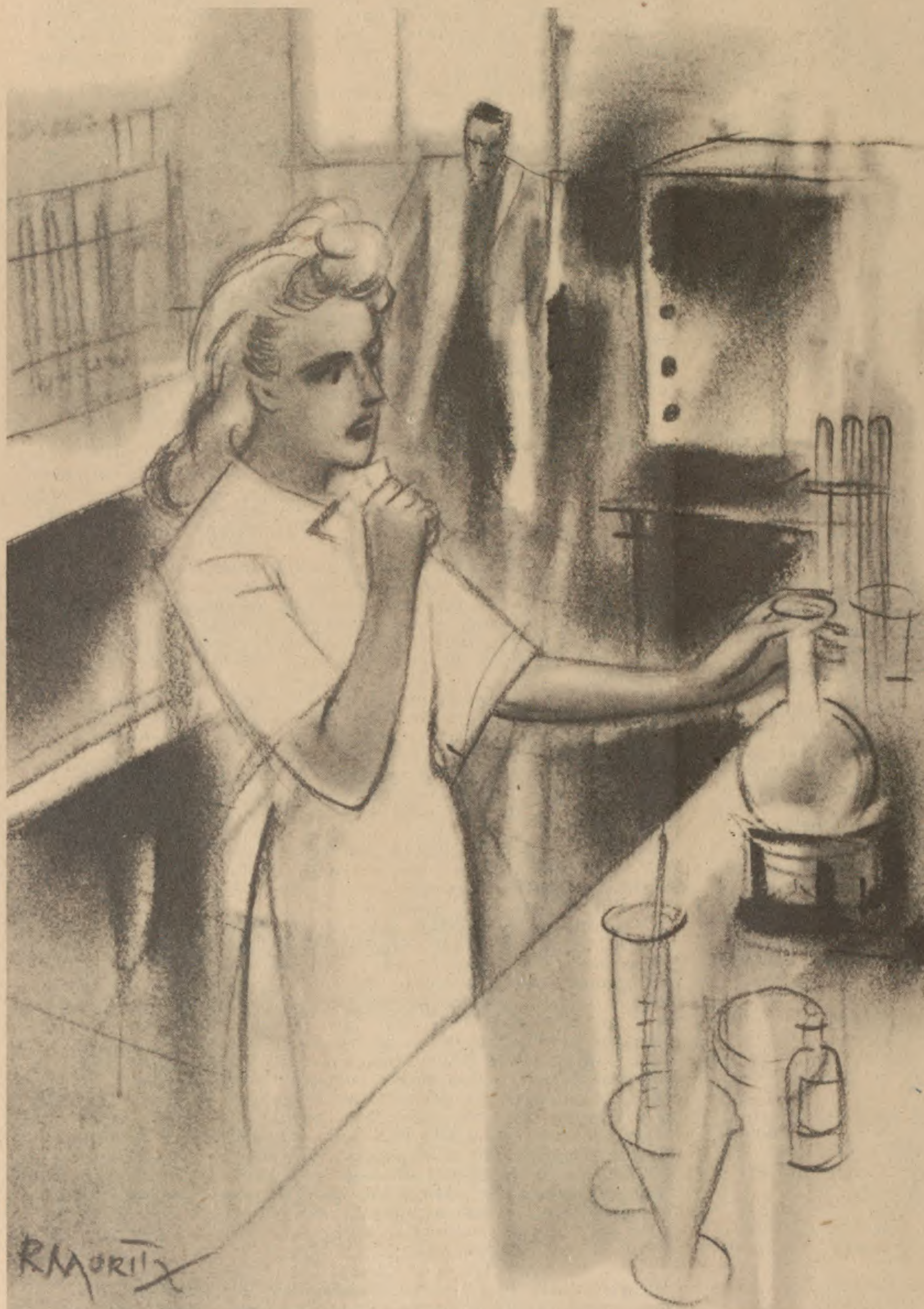
Elle poussa un cri de douleur, mais il lui fut impossible de bouger.