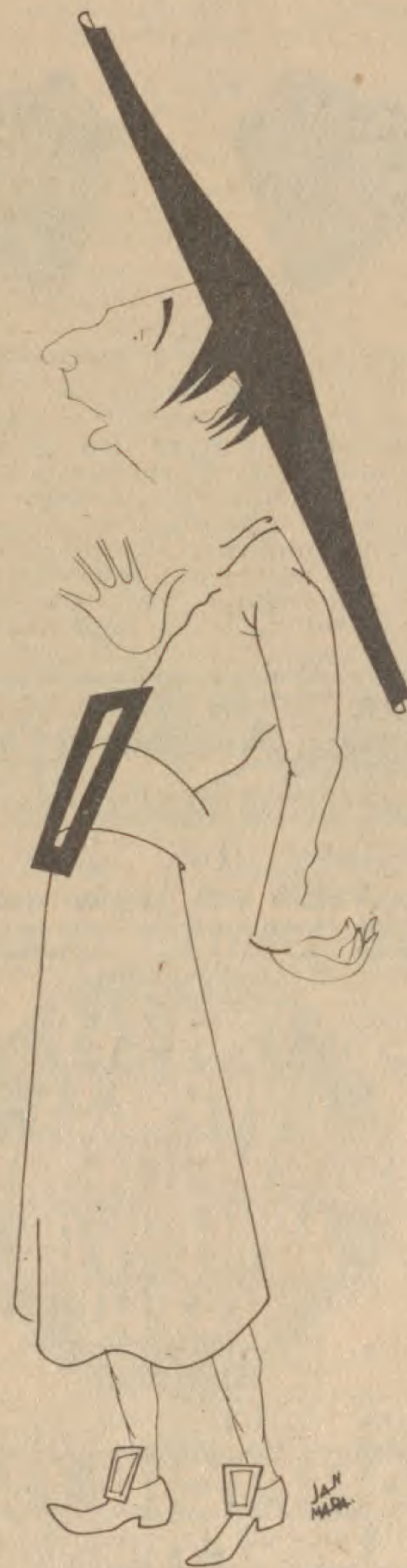
PIERRE BERTIN qui est Basile dans le Barbier de Séville, au Théâtre Français.

T. l. j., matinées 15 h., soirée 20 h. 15 (sauf vend.)