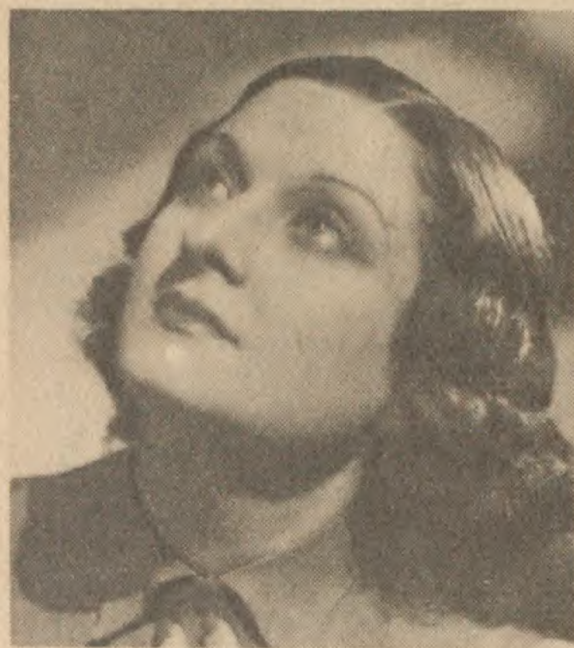
LUCIENNE DELYLE