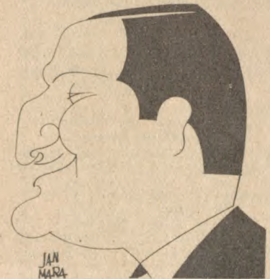
LE CHANTEUR SANS NOM

suis près de toi (arrgt R. Le-grand); La chanson de Marinette (Tagliafico-R. Legrand), par Jo Bouillon et son orchestre