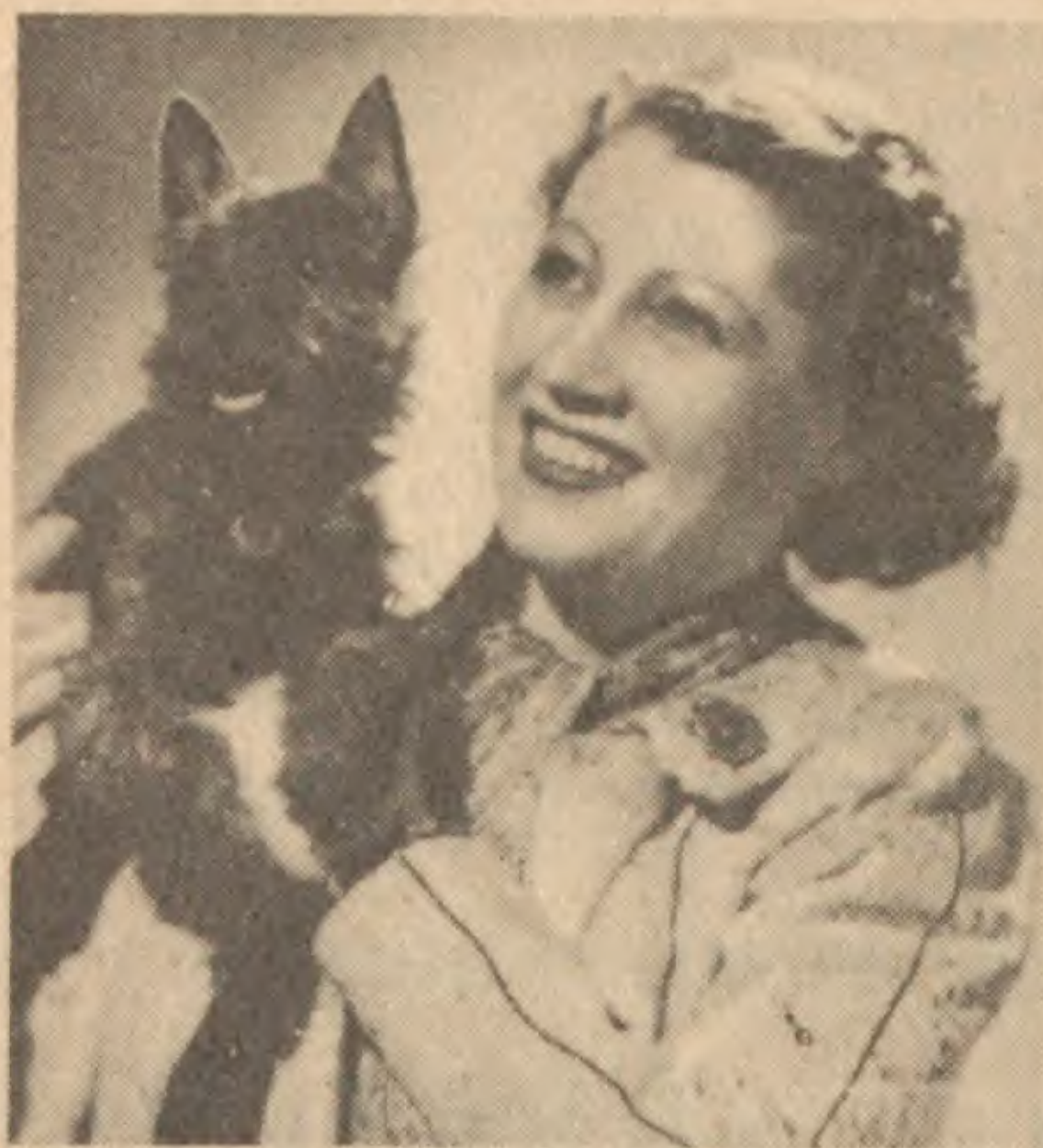
GERMAINE SABLON