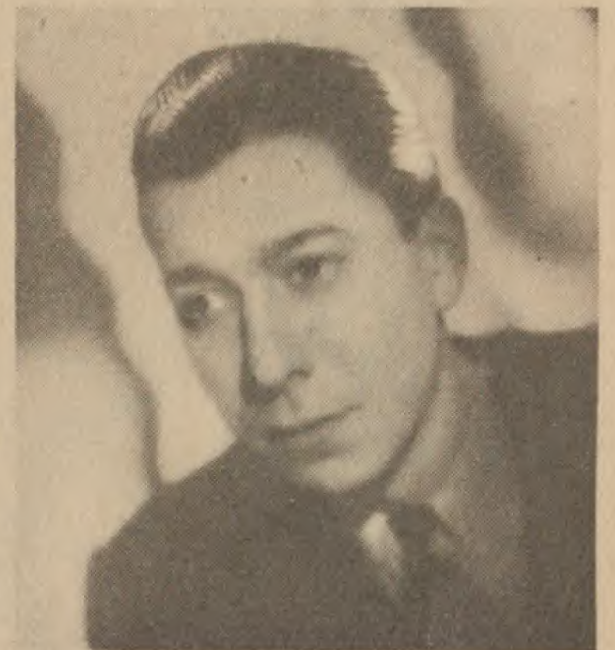
PAUL MEURISSE