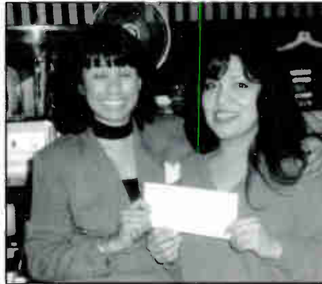
LISTENER WINS ON GANANDO Y VOLANDO PROMOTION

Ganando y Volando es un favorito de los oyentes y continúa atrayendo un número abrumador de participantes. Los radioyentes pueden "ganar y volar" con llenar una forma oficial de registro, y entregarlo en las cajas de registraci3n. Desde Lunes a Viernes, personajes de radio WOJO escoger3n y