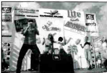
DANCERS ON STAGE AT CALLE OCHO

O n Sunday, March 9, 1997 WAMR-FM, WRTO-FM, WAQI-AM and WQBA-AM participated in Calle Ocho, a musical extravaganza covering 27 blocks of entertainment, big National clients, and over 1,000,000 in attendance! WAMR-FM and WQBA-AM sponsored both the Sears and the Coca-Cola stages. WRTO-FM sponsored the Budweiser stage and WAMR-FM and WAQI-AM sponsored our own stage with over 7 major sponsors and 10 booths. The event was remarkably profitable and successful.