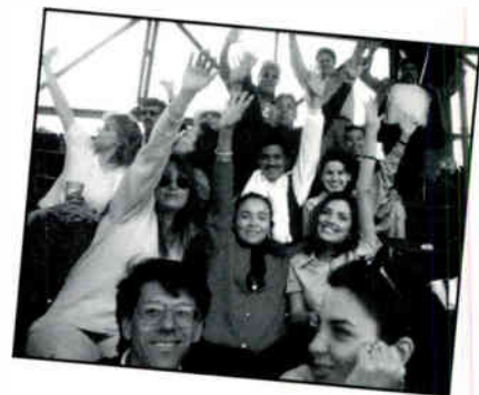
AMOR DOES THE WAVE IN SUPPORT OF THE TEXAS RANGERS