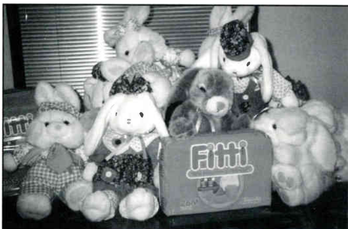
FITTI DISPOSABLE DIAPERS EASTER PROMOTION

Su introducción a nuestro mercado consistió en siete semanas de publicidad y un concurso de tres semanas. Parece que les gustó el resultado porque este año han regresado con un concurso de Pascuas (regalando peluches a los chiquillos), participación en el Cinco de Mayo, mas 13 semanas de publicidad. OJO a todos los padres, "cuando es hora de cambiar" a su bebé, recuerden los pañales desechables, Nuevos Fitti (los de los globitos con las caritas sonrientes).