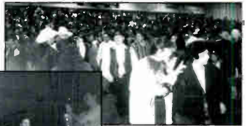
SOME OF THE 8,500 ATTENDEES AT QUE BUENA'S 11TH ANNIVERSARY PARTY

KBNA, Chevron y el Departamento Policial de El Paso tuvieron gran impacto en los niños de El Paso, Texas, al patrocinar el "Día de Identificación de los Niños" febrero 15. Tomamos huellas digitales y fotografías de todos los niños, además de sacarles en video. Esperamos que estos artículos nunca se necesiten, pero nos consuela saber que las familias de estos niños tienen la protección de estos documentos importantes.