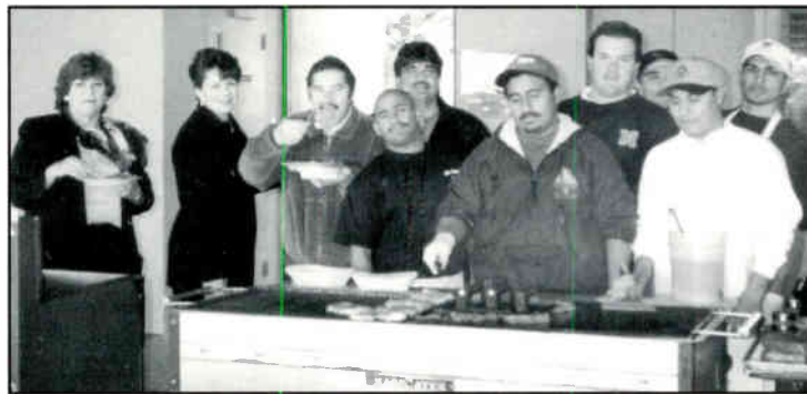
OUTBACK STEAKHOUSE FEEDING THE HUNGRY STAFF AT KBNA/KAMA

I n February, The OutBack Steakhouse showed how happy they were due to the results they got during their advertising campaign by giving us a big cookout in the parking lot of KBNA & KAMA. The OutBack Steakhouse crew and owner grilled steaks and shrimp for the KBNA and KAMA staff. Boy was it goooooo!!! We are looking forward to another one soon.