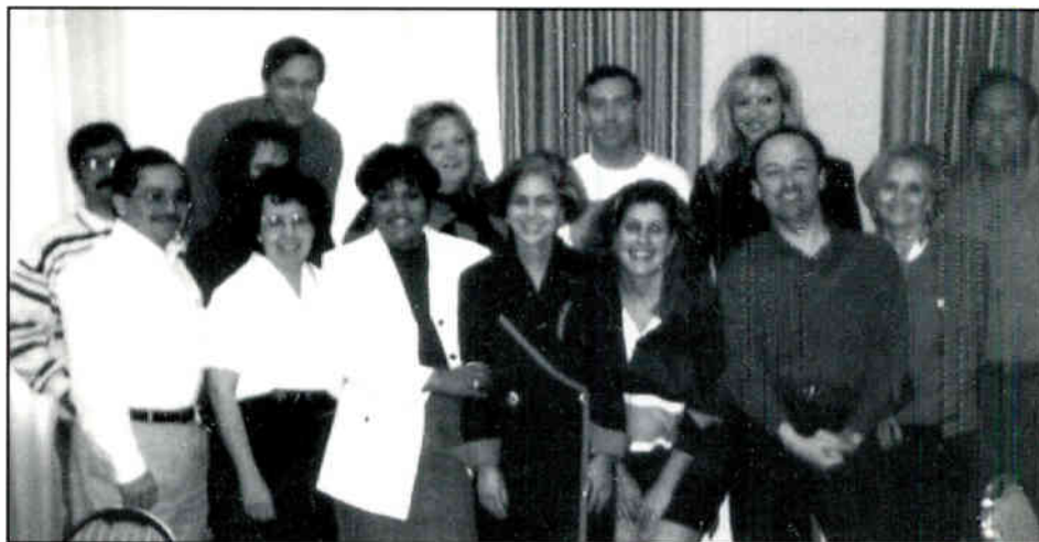
BUSINESS MANAGER MEETING ATTENDEES POSE FOR A GROUP PICTURE AS THE BUSINESS MANAGERS' MEETING DRAWS TO A CLOSE

La primera Junta de Gerentes para el nuevo Heftel tomó lugar en Dallas en el mes de febrero. Los gerentes generales de radiodifusoras, directores de programa y gerentes de venta se juntaron para aprender más de Heftel Broadcasting Corporation.