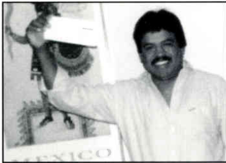
ONE OF THE CASH WINNERS OF A KLTN AND KRTX PROMOTION

Cientos de radiooyentes de Estereo Latino y Puro Tejano se registraron para una rifa promocional de $100 por cada radiodifusora. Se pidieron a los oyentes llamar y demás su nombre y teléfono en la grabadora de la radiodifusora. Cada hora, personajes de radio de KLTN y KRTX seleccionaron al azar un participante ganador. ¡Felicitaciones a los oyentes afortunados!