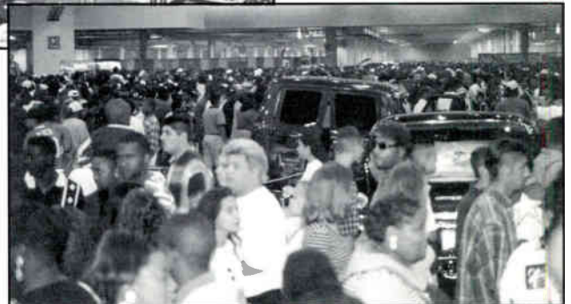
SOME OF THE OVER 50,000 ATTENDEES AT THE LOS MAGNIFICOS CAR SHOW AND EXHIBITION