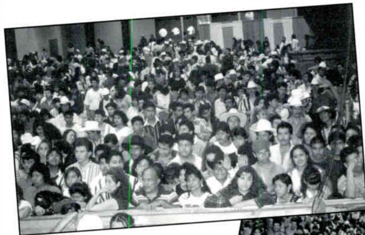
WHAT A CROWD! EXCITED PEOPLE AT THE 17TH FIESTAS PATRIAS

El día Domingo, Septiembre 8, 1996, KLAT/CLTN/KRTX celebraron las 17a. Fiestas Patrias en el Astroarena. El evento era gratis al público y asistieron más de 60,000 personas de Houston y áreas vecinas. Personajes del aire de KLAT/CLTN/KRTX eran los anfitriones y contribuyeron al gran éxito del evento. Los asistentes gozaron una variedad de comida y buen entretenimiento. El registro gratuito y sin limites para ganar premios aseguró que se ganaran varios premios fabulosos donados por varios patrocinadores. Artistas invitados incluían Invasores de Nuevo León, Grupo Mojado, Laura Flores, Los Humildes, Ballet Folklórico, música Mariachi y mucho mas.