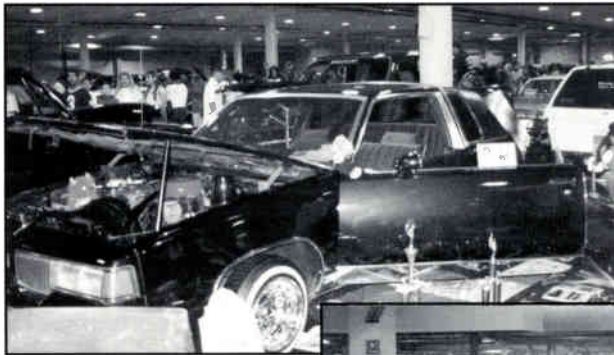
ONE OF THE MANY CARS ON EXHIBIT AT LOS MAGNIFICOS CAR SHOW AND EXHIBITION IN HOUSTON